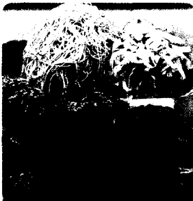
STREETFOOD AUF DEM BOGYOKE-AUNG SAN-MARKT S. 56. YANGON