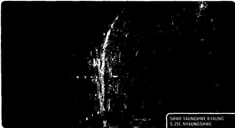
SHWE YAUNGHWE KYAUNG S. 211. NYAUNGSHWE