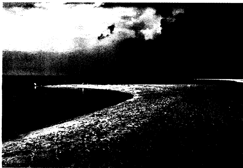
Der Strand von Liseleje an der Kattegatküste ist einer der schönsten Dänemarks