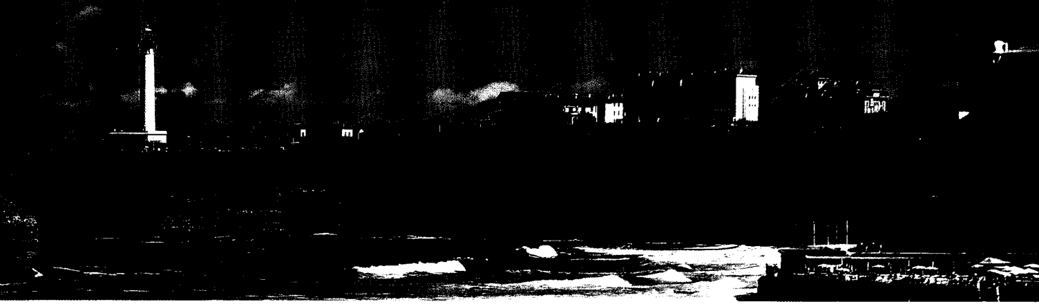
Blick von der Grande Plage in Biarritz auf den Leuchtturm auf der Pointe Saint-Martin.