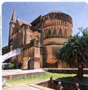
SKLAVEN-MAHNMAL, ANGLI-KANISCHE KATHEDRALE S. 83