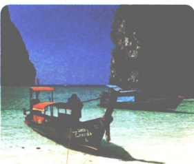
KO PHI-PHI DON S. 363