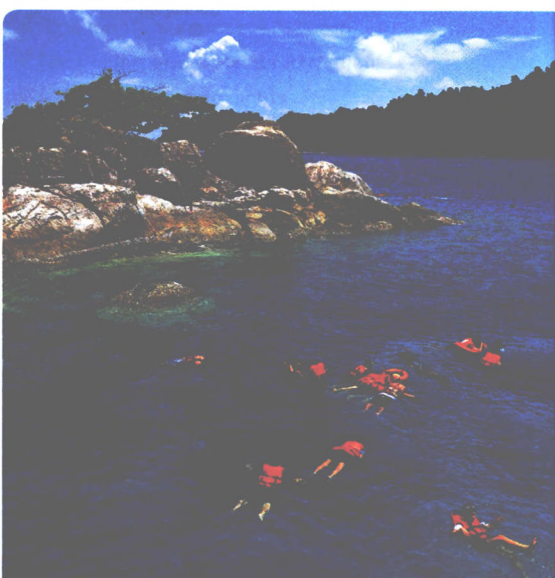
SCHNORCHELN VOR KO CHANG S. 158