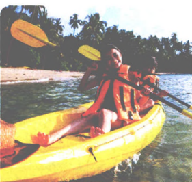
KAJAK FAHREN UM KO KUT S. 168