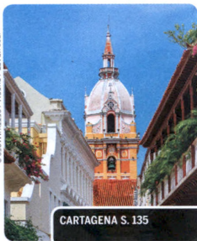
CARTAGENA S. 135