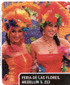
FERIA DE LAS FLORES, MEDELLÍN S. 213